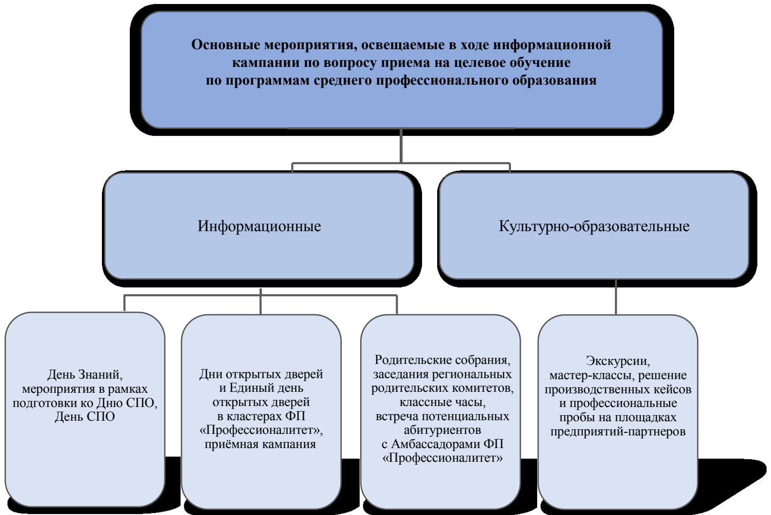
Рисунок 1. Основные мероприятия, освещаемые в ходе информационной кампании

При планировании информационной кампании рекомендуется учитывать следующие аспекты: